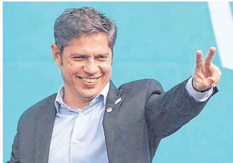
KICILLOF PRESENTARÁ HOY EN EL COLISEO LA USINA DE IDEAS DEL MDF/WEB

El viernes, en tanto, la agenda oficial prevé actividades de gestión en la Isla Martín García, con recorridas e iniciativas ligadas a infraestructura y presencia del gobierno provincial, gesto con el que el kicillofismo busca reforzar su discurso de federalización interna del territorio bonaerense.