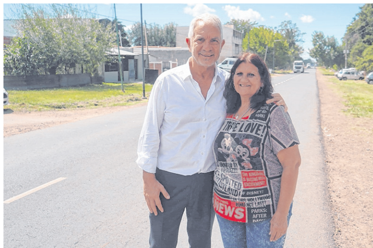
EL INTENDENTE, AYER, AL RECORRER LA OBRA DE LA AVENIDA 38/MLP

rías que posee el partido, se encuentran, además del alakismo, miembros de La Cándida, que