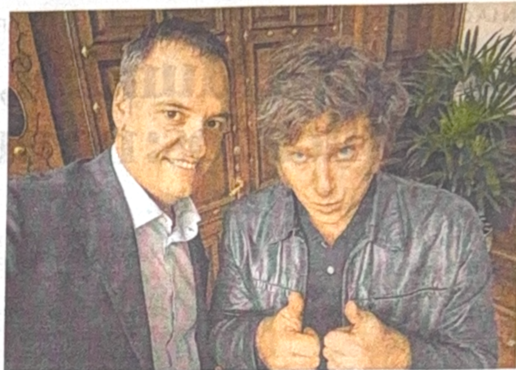
FOTO DE ARCHIVO. AYER NO SE DIFUNDIERON DEL ENCUENTRO MILEI / ADORNI

Pero la danza de nombres sigue en marcha. El canciller Pablo Quirno; los ministros Diego Santilli (Interior) y Sandra Pettovello (Capital Humano) y Eduardo "Lule" Menem, subsecretario y mano derecha de Karina Milei, son algunos de los nombres que vuelven a sonar para reemplazar al jefe de Gabinete.