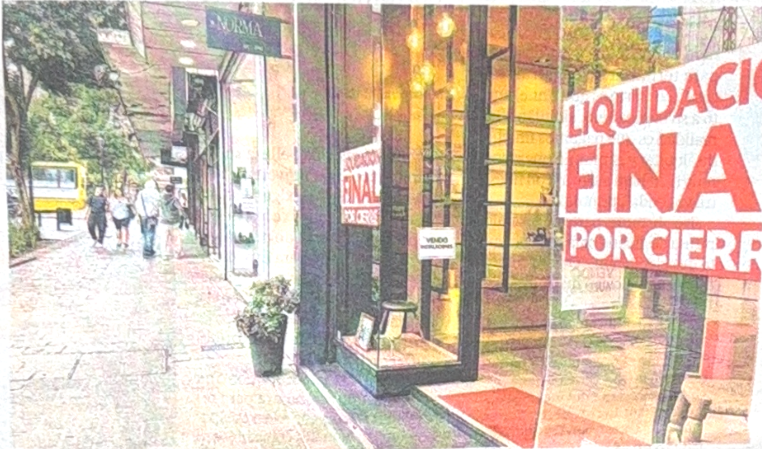
LOS PRECIOS DE LOS ALQUILERES DE LOCALES SE MANTIENEN FIRMES EN CALLE 8

Las cotizaciones se mantienen altas en un contexto de caída del consumo. En calle 12, hasta 20 millones de pesos