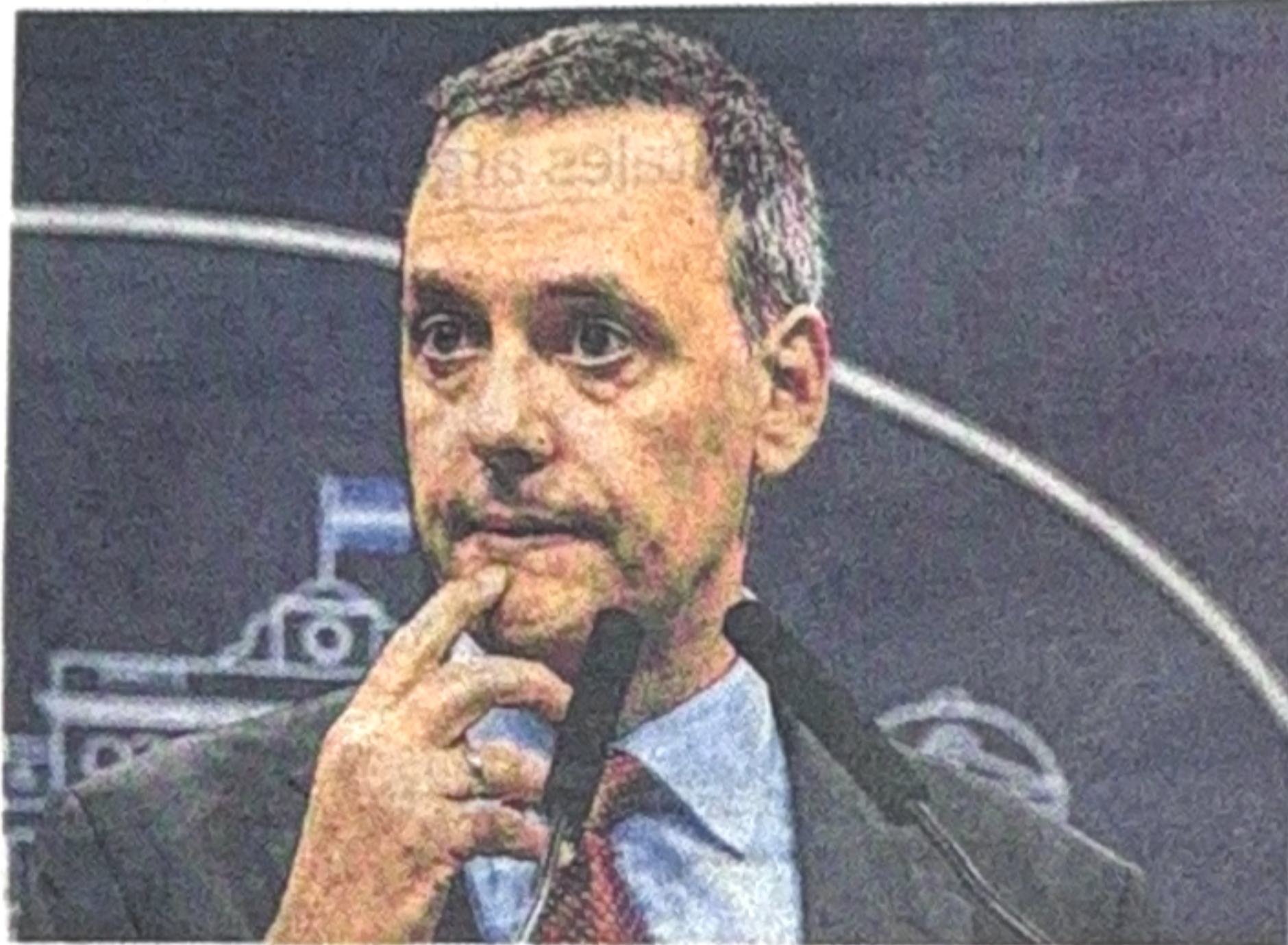
MANUEL ADORNI

De acuerdo con informes oficiales consultados por la investigación, no hay registros de ingresos de Adorni a la Casa Rosada entre el 27 de diciembre de 2024 y el 6 de enero de 2025. Tampoco figuran autorizaciones suyas para el ingreso de terceros durante ese período.